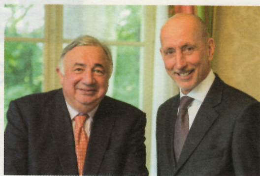
Serge Dassault Sénateur de l'Essonne Président du Comité de soutien