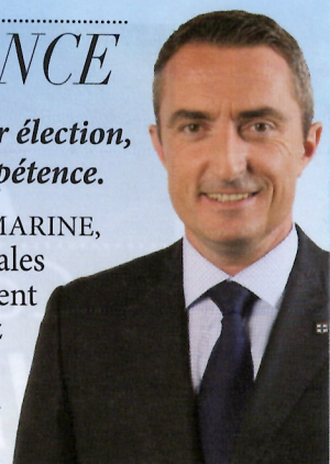
Stéphane Ravier Sénateur des Bouches-du-Rhône Maire des 13 et 14 ards de Marseille