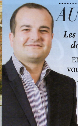
David Rachline Sénateur du Var Maire de Fréjus

EN ÉLISANT UN SÉNATEUR DE LA LISTE BLEU MARINE, vous permettrez aux 10,6 millions de voix nationales recueillies à la présidentielle d'être plus justement représentées au parlement. Vous permettrez aussi à votre département et à votre commune d'être défendus plus efficacement.